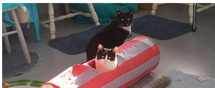
Maja och Olle